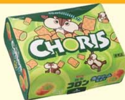
ちょリスオリジナルパッケージ 抹茶コロソ (江崎グリコ)