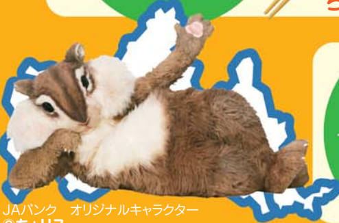
JAバンク オリジナルキャラクター ©ちょリス