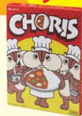
ちょリスオリジナルパッケージ カレー職人 (江崎グリコ)