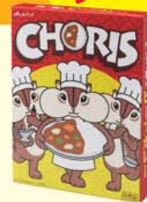
ちょリスオリジナルパッケージ カレー職人(江崎グリコ)