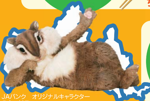
JAバンク オリジナルキャラクター ©ちょリス