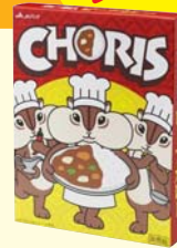
ちょリスオリジナルパッケージ カレー職人(江崎グリコ)