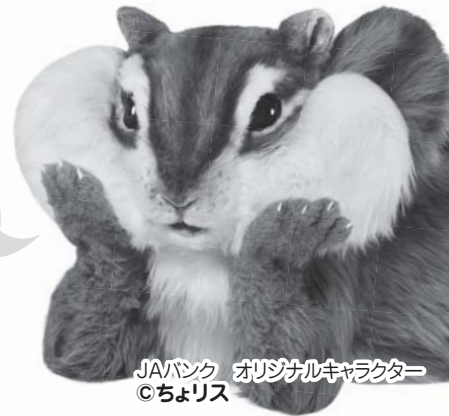
JAバンク オリジナルキャラクター ©ちよリス