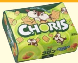
ちょリスオリジナルパッケージ 抹茶コロン(江崎グリコ)