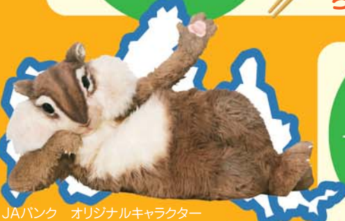
JAバンク オリジナルキャラクター ©ちょリス