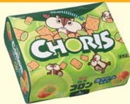
ちょリスオリジナルパッケージ 抹茶コロン(江崎グリコ)