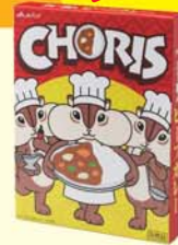
ちょリスオリジナルパッケージ カレー職人(江崎グリコ)