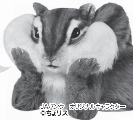
JAバンク オリジナルキャラクター ©ちよリス