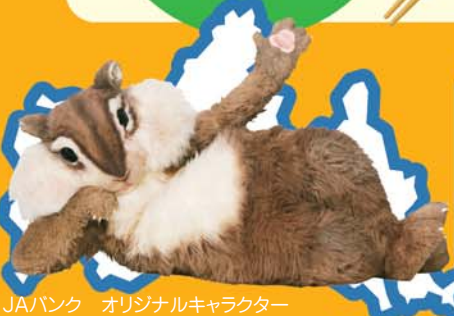
JAバンク オリジナルキャラクター ©ちょリス